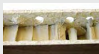
Bohrervergleich links: Standardbohrer rechts: LEUCO VHW-Dübelbohrer