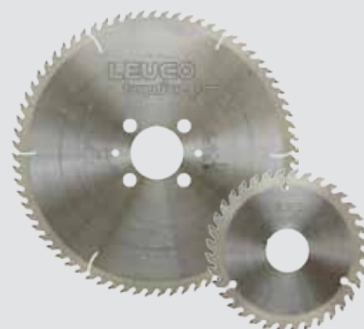
LEUCO Special Edition