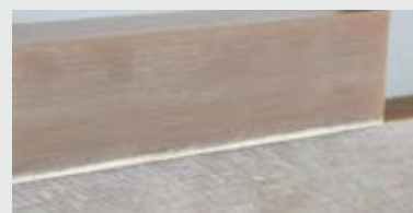
Oben: sauberer Schnitt mit „UniCut PN“ Unten: Schnitt mit Standard-Sägeblatt