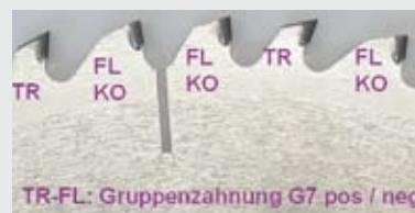
TR-FL: Gruppenverzahnung G7 pos / neg Schema der „UniCut PN“