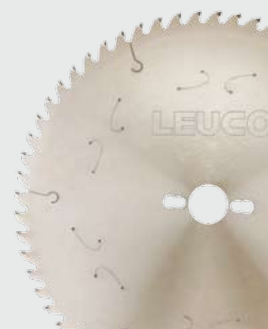
LEUCO Diamant Sägeblatt „UniCut PN“